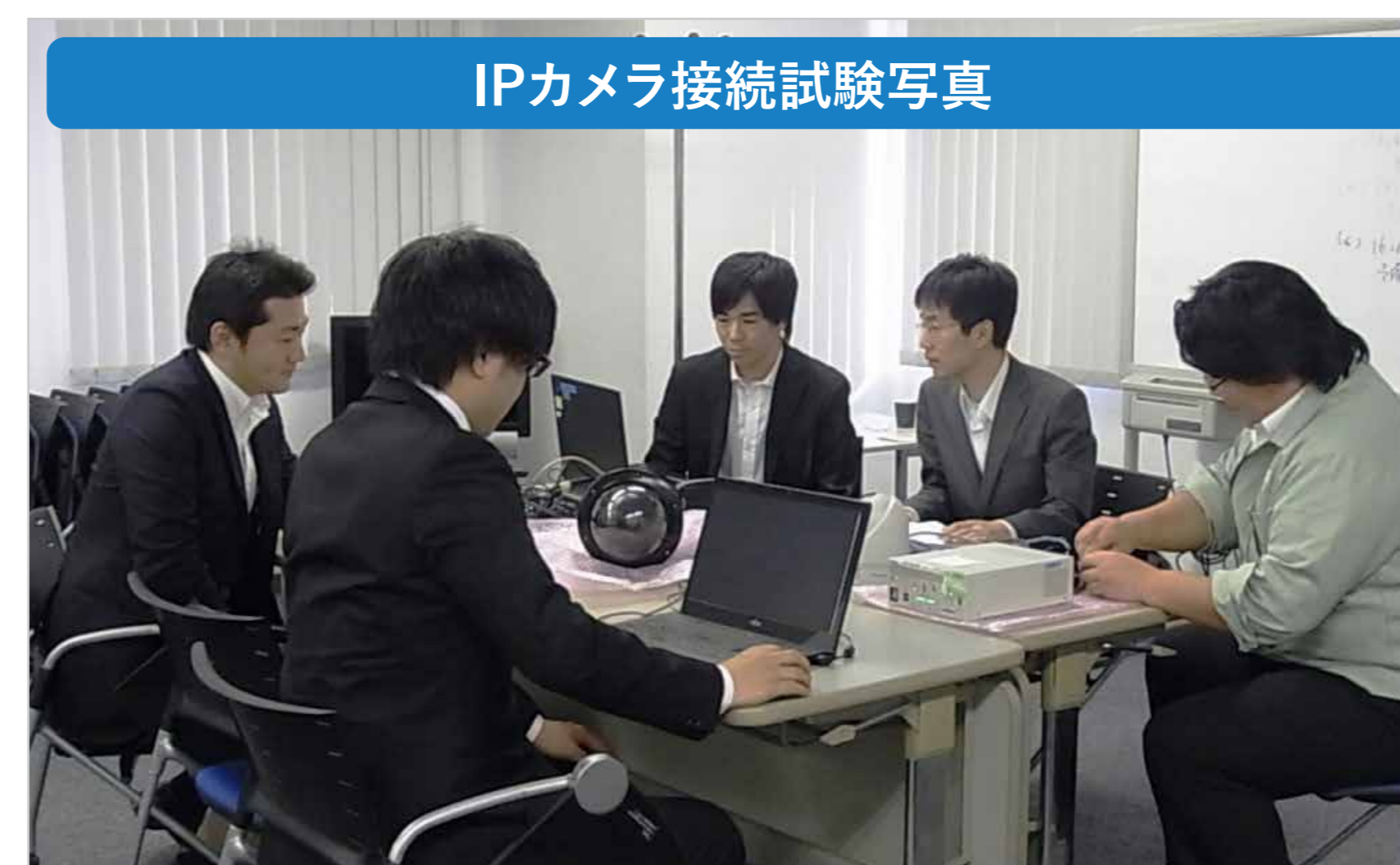
IPカメラ接続試験写真